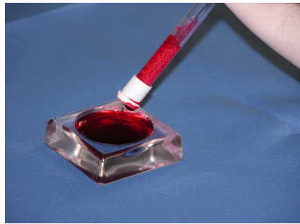
2. Überschüssige Flüssigkeit